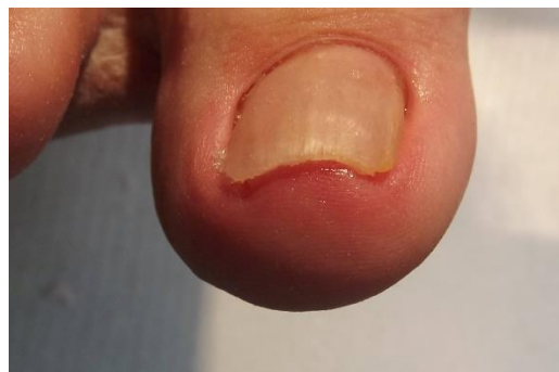
Ná de behandeling