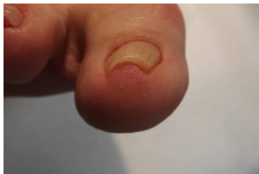
Vóór de behandeling